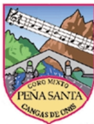
Coro Mixto "Peña Santa" de Cangas de Onís